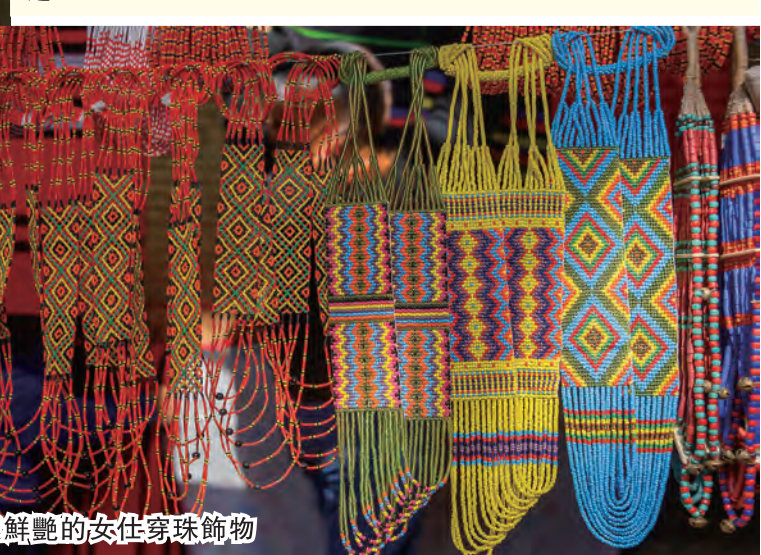
■色彩鮮艷的女仕穿珠飾物

飾，十分搶眼！除了各類表演和展覽外，還有各式各樣的比賽如摔跤、射箭、拔河、在竹桿上賽跑和慶典的高潮選美競賽。這山邦的年度節慶有助加強各部落間的交流和凝聚感情。 但為何命名為「犀鳥祭」呢？犀鳥，又稱大咀鳥，因其羽毛色彩艷麗，體型比其他鳥大，在那迦蘭邦各部落間流傳不少多姿多彩的民間故事。有些原住民認為犀鳥是鳥中之皇，等同中國傳說的鳳凰！“七姊妹”之一的Arunachal Pradesh的邦象徵鳥便是犀鳥。犀鳥的長咀上長有一片盔，族人用以做成雕刻或飾物，與犀鳥的羽毛同被視為珍貴裝飾。在馬來西亞沙勞越的伊班族（Iban）亦有舉辦類似的犀鳥祭，用以慶祝每年的水稻豐收。 在欣賞表演之餘別忘一嚐那迦蘭邦的特色地道菜餚。烤蠶幼蟲受當地人歡迎；一些村落有傳統吃狗肉和白老鼠的喜好。「鬼椒」（Bhut Jolokia）則千萬別試，這是全球最辛辣的調味食材之一！