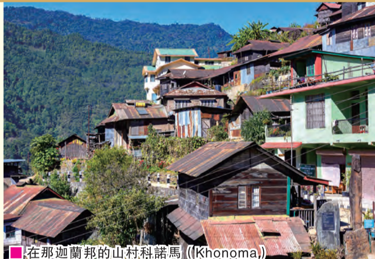
■在那迦蘭邦的山村科諾馬 (Khonoma)