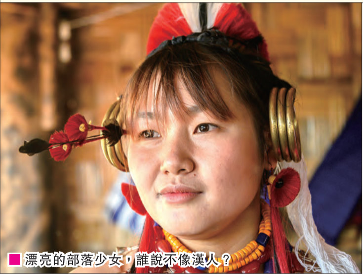
■漂亮的部落少女，誰說不像漢人？

「阿薩姆」（Assam）是以出產茶葉聞名於世。東北八邦有十多個主要的民族和百多個比較細的少數族裔，各有自己的語言、傳統和文化習俗。那迦蘭邦擁有超過八百多個村莊，很多仍保存著數百年的原始部落生活方式，首府是「科希馬」（Kohima）。