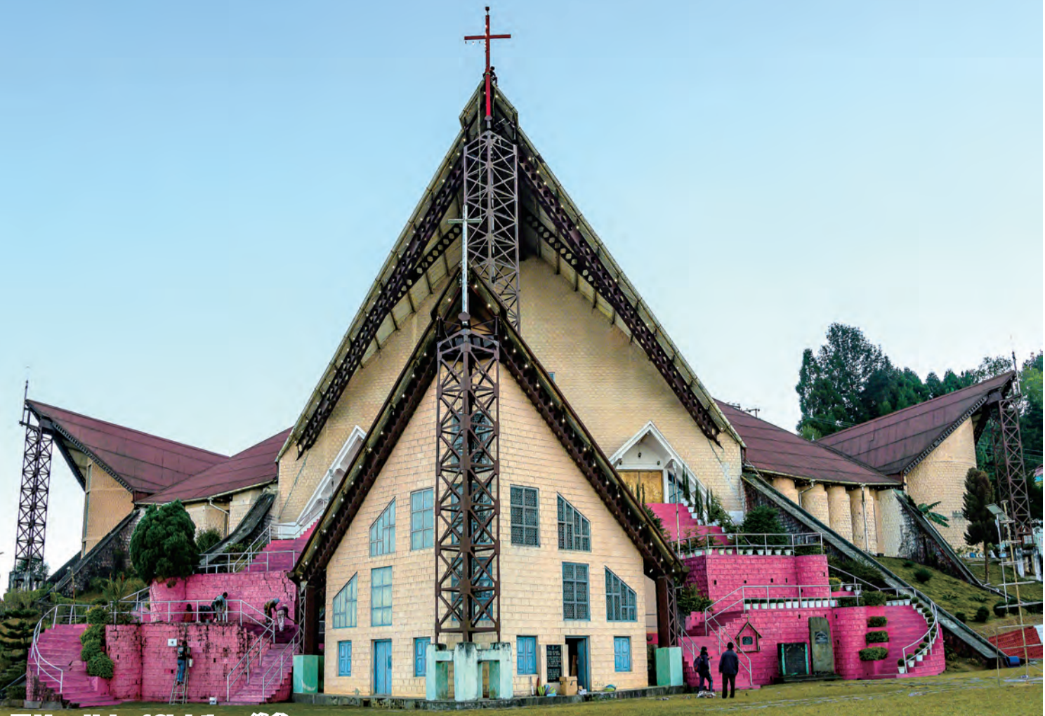
■Mary Help of Christians 教堂

在印度的東北部，沒有首都新德里或第二大城孟買，極稠密人口、不斷的車水馬龍和幾乎令人窒息的污染空氣；也看不到在泰姬瑪哈陵或阿格拉紅堡這些旅遊熱點的川流不息旅巴和一波接一波來自五湖四海的遊客。印度東北部位於巍峨的喜馬拉雅山麓，由八個邦地組成，“邦”等如中國的省或美國的州。這一大片的樂土與中國西藏、尼泊爾、不丹、孟加拉和緬甸五國的邊界接壤。地形主要是崇山峻嶺、大嶺大河，平地不多。每年的季候風（Monsoon）帶來充沛雨量，群山高地草木青蔥，全印僅有的熱帶雨林可在此尋！這處的村莊與小鎮星羅棋布，很多祇靠羊腸小徑相連。大雨過後常常水氣蒸發，造成煙霧繚繞，小鎮樓房若隱若現，由高處遠瞰，如油畫般美！