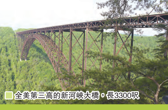
全美第三高的新河峽大橋，長 3300 呎