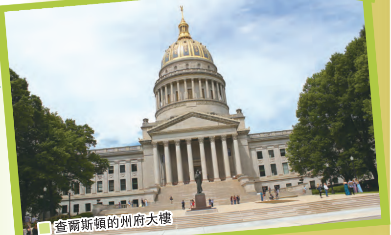
查爾斯頓的州府大樓