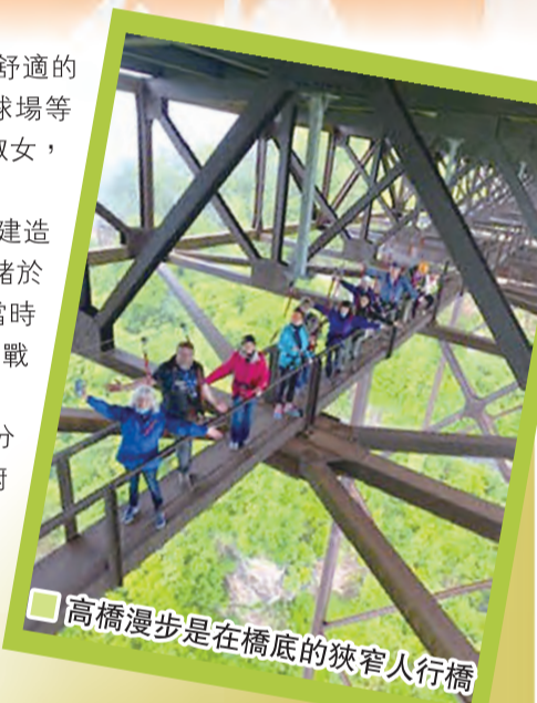
高橋漫步是在橋底的狹窄人行橋

★網址和查詢電話 adventuresonthegorge.com 888-806-0984