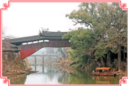
溪東橋(下圖)和北澗橋(左圖)合稱為「姊妹橋」，被視為世界上最美的廊橋。