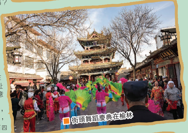
■ 街頭舞蹈慶典在榆林