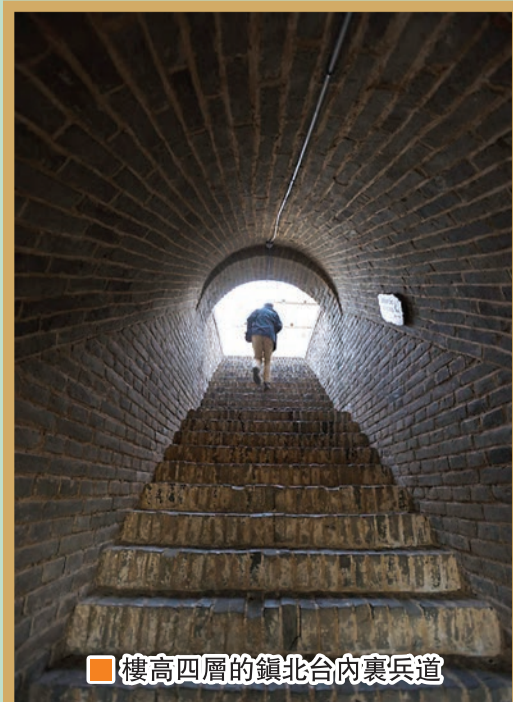
■ 樓高四層的鎮北台內裏兵道