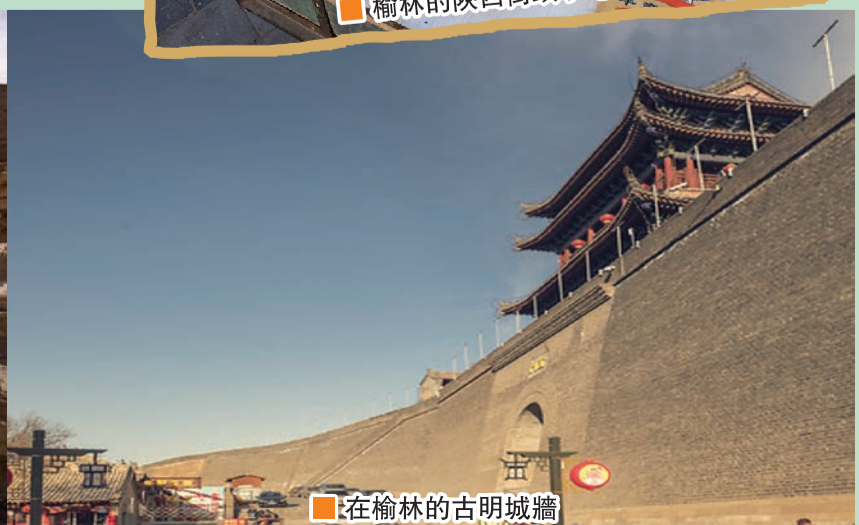
■ 在榆林的古明城牆