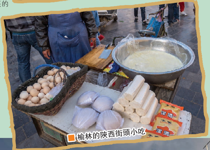
■ 榆林的陝西街頭小吃

把一排鼓樓建築成一線排列，像馬一樣“騎”在當街上！在榆林城北四公里之紅山頂上的「鎮北台」，建於明萬曆三十五年（1607），有四百多年歷史，是明長城上最大的瞭望台，也是現存長城上最大的烽火台，自古便被稱為“萬里長城第一台”，與山海關、嘉峪關和居庸關共稱長城四大關口。鎮北台有四層高，登上台頂可極目四方，視野極廣闊。古時有敵人來襲時會在台頂燒煙作警報訊號，以野狼乾糞燒的煙火是直升上天的，所以古語“大漠烽煙直”和“狼煙”是有根據的。