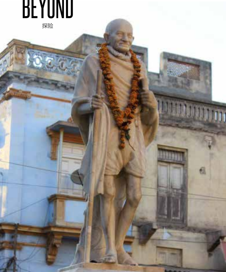
甘地的铜像；印度的Masala拉茶，是这样外卖的；对页：打扮漂亮的骆驼，等候游客的青睐；Somnath庙，印度最神圣的庙宇之一。

从艾哈迈达巴至亚洲狮生活的“Gir野生动物保护区和国家公园”(Gir Wildlife Sanctuary & National Park)约四百里路程，取道8A转8B公路，需一整天的时间才能到达位于古省西南部Sasan镇的公园入口。古邦的公路质量仍有待极大改善，很多段车道仍未铺柏油，沙尘滚滚，凹凸不平。有些旧桥宽度只能容许一辆车通过，迎头车必需等候轮流过桥。我坐的中型巴士没设卫生间，当乘客需要方便时，司机往往把车停在路边让人下车到草丛就地解决，真是陋习难改！