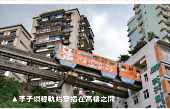
▲李子壩輕軌站穿插在高樓之間