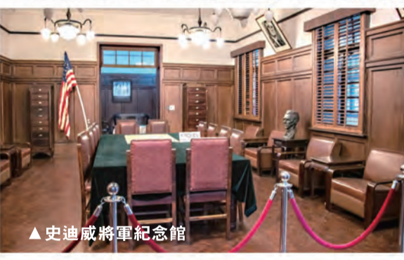
▲史迪威將軍紀念館