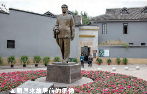
▲周恩來故居前的銅像