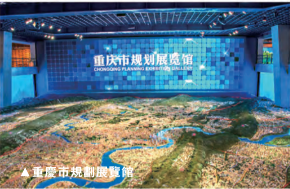
▲重慶市規劃展覽館