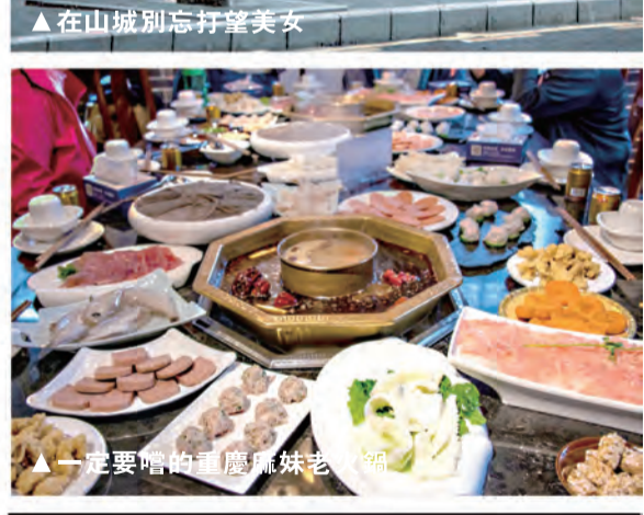
▲一定要嘗的重慶姊妹老火鍋