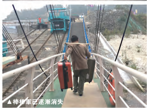
▲棒棒軍已逐漸消失