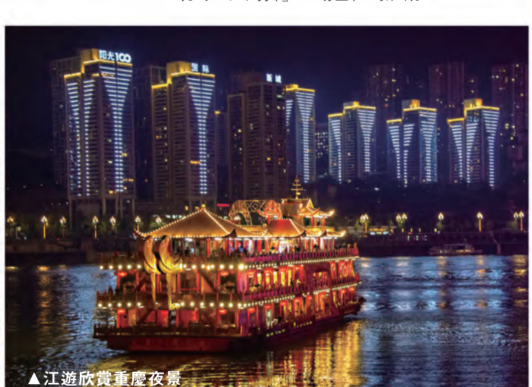
▲江遊欣賞重慶夜景