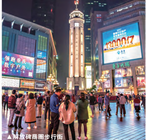
▲解放碑商圈步行街