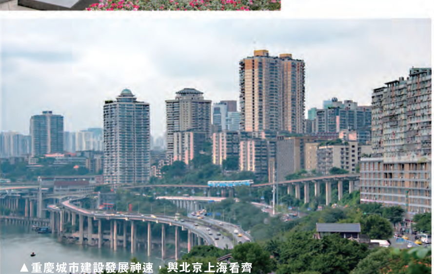
▲重慶城市建設發展神速，與北京上海看齊