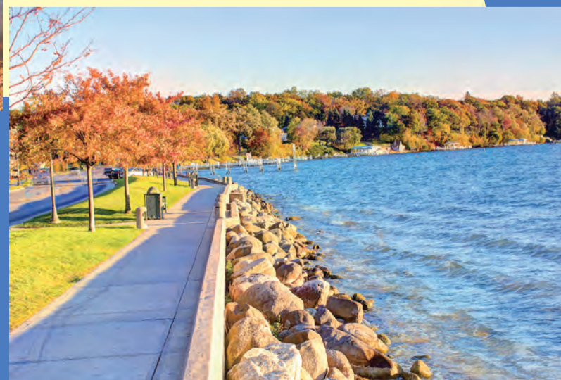
在「圖書館公園旁」的行人步徑