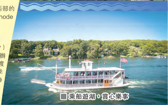
乘船遊湖，賞心樂事