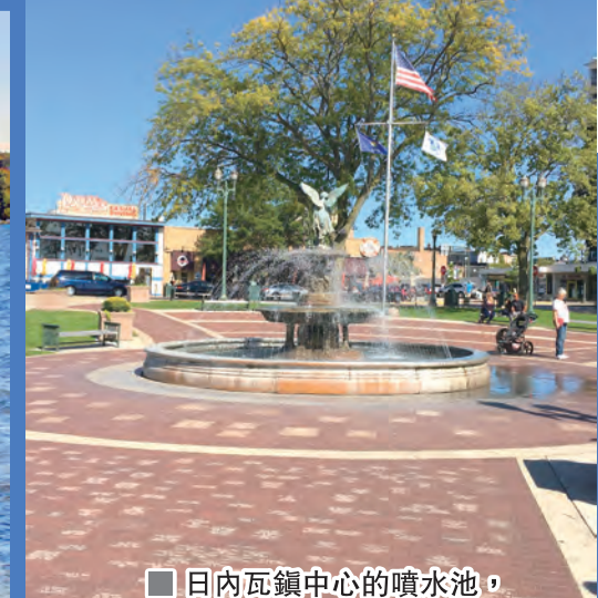
日內瓦鎮中心的噴水池，居民碰面閒談的約會點