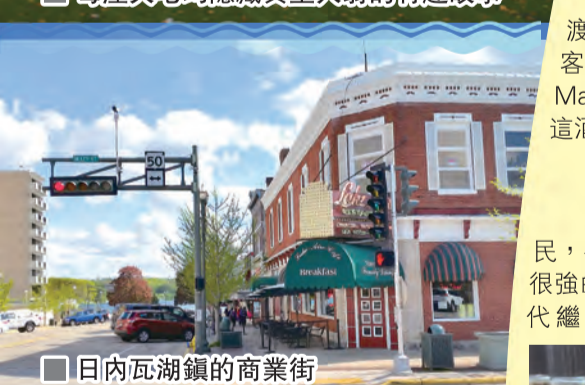
日內瓦湖鎮的商業街