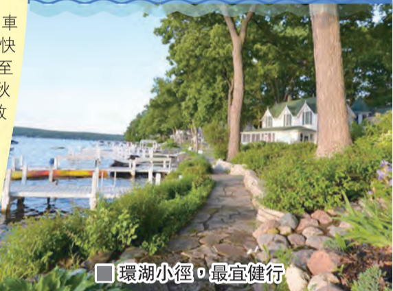
環湖小徑，最宜健行

沿著整個日內瓦湖岸亦築有健行小徑，全長二十哩，如果走畢全程需時八個鐘，所以建議祇體驗步行一部分，由市內的「圖書館公園」(Library Park) 起步為佳。走累了回到鎮中的Sprecher's 餐廳挑了一倚窗的位置坐下，喝一杯威州著名的沙士 (Sprecher's Root Beer)，欣賞遠處的落日餘暉，人到此時亦無甚可求了！