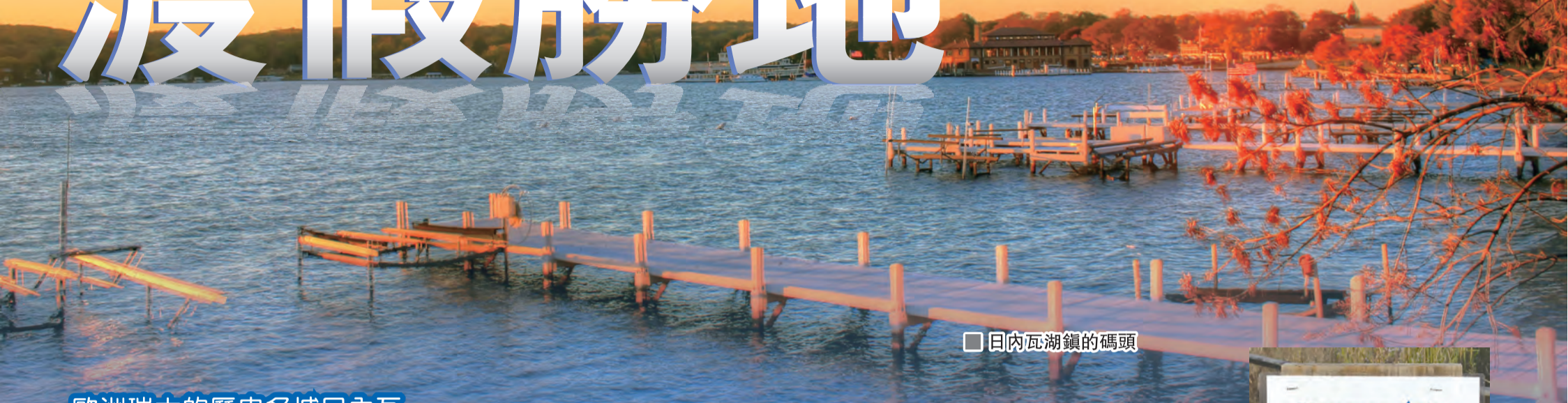
日內瓦湖鎮的碼頭