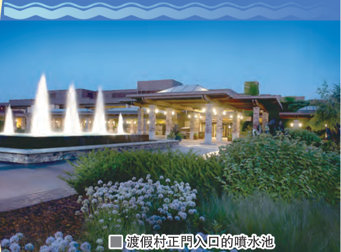
渡假村正門入口的噴水池