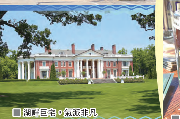
湖畔巨宅，氣派非凡