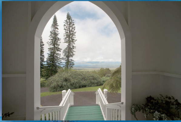
▲ 由教堂的大門遠望茂宜島外的太平洋