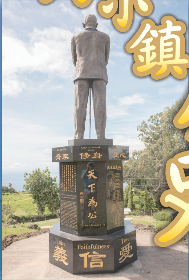
▲ 國父的銅像，遠望太平洋彼岸的中國