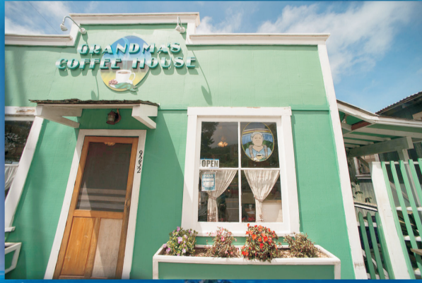
▲ 祖母咖啡屋的綠色外牆