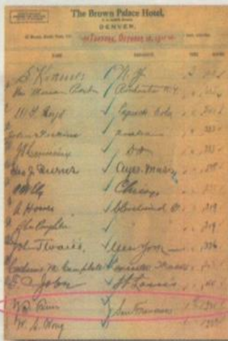
國父的簽名還保存在酒店的貴賓名冊內。

布朗宮於1892年落成開業，維多利亞式的建築配以義大利文藝復興的裝潢，華麗典雅。當時的200萬建築費已是天文數字。歷年來，從羅馬尼亞皇后，披頭四天王至柯林頓總統，均為酒店上賓。孫中山先生曾住的321號房為角落大房，面臨街景，現已闢為歷史紀念房，不再對外開放。孫中山為革命奔走，到丹佛主要