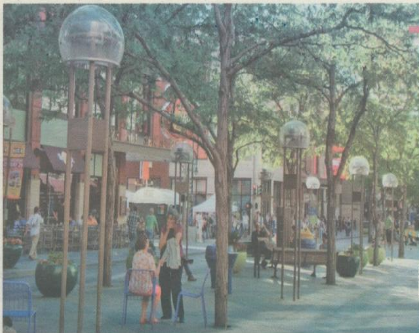
今時丹佛市中心最熱鬧的地段為第16商街。

布朗宮酒店內的Atrium Lobby，維多利亞式的建築配以義大利文藝復興的裝潢，華麗典雅。