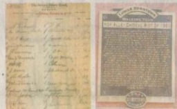
布朗宮酒店的人住名冊。有孫父的簽名。紀念丹佛華埠的紀念碑。

1940年時，丹佛的華人數量降至100人左右，缺乏足夠的經濟能力去支撐一唐人埠。同年6月，市府下令拆遷僅剩的華埠以便開地建新住宅區，正式敲響華埠的喪鐘！時至今日，唯一