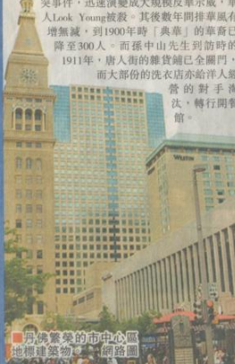
丹佛繁榮的市中心區地標建築物。網路圖

孫中山先生為革命奔走，到丹佛主要向華人募款，據紀錄共籌得美金500元。其實在1911年時丹佛市內華人已不多，唐人街已漸式微。華人主要集中在市外的金礦工作。追溯至1880年代時，丹佛的華埠曾繁盛一時。當時地處於Blake街和Market街，介於19th和22nd街之間的唐人集中地，有約500人口；洗衣店、雜貨舖和鴉片煙館林立。但不幸地在1880年10月11日夜間，在一桌球室內發生醉洋漢與華人衝突事件，迅速演變成大規模反華示威，華人Look Young被殺。其後數年間排華風有增無減，到1900年時「典華」的華裔已降至300人。而孫中山先生到訪時的1911年，唐人街的雜貨舖已全關門，而大部份的洗衣店亦給洋人經營的對手淘汰，轉行開餐館。