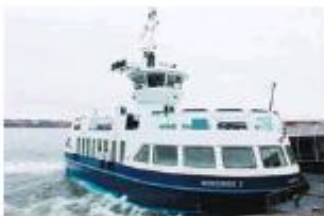
小渡輪在哈港平靜的水上慢駛時，一幕幕乘搭港九渡海小輪的親切印象，悠然湧現在心頭。

在Morris和Queen街交界處的「大西洋報攤」(Atlantic News)，是愛讀報紙和雜誌的朋友之夢想大觀