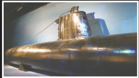
■ 日本偷襲珍珠港的迷你潛艇。