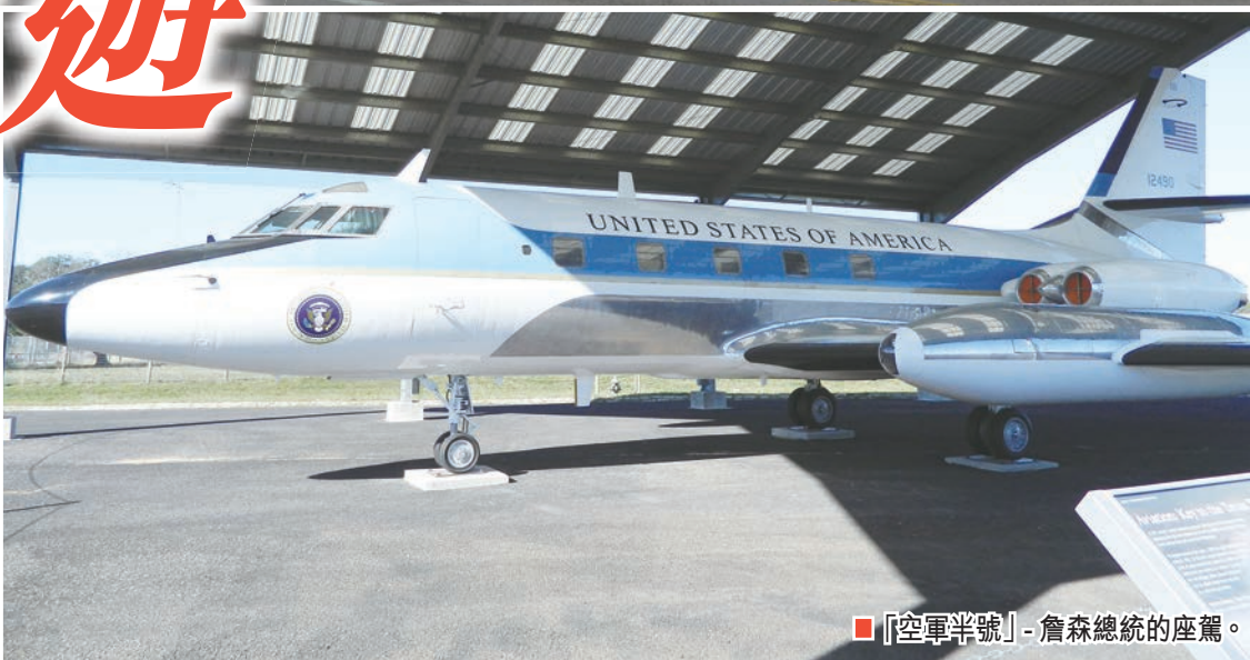
■ 「空軍半號」- 詹森總統的座駕。

佛堡由來自德國的移民建鎮，是德州的第一條德裔村。相比於愛爾蘭或意大利裔移民湧向美東岸各大城市如波士頓和紐約，德州吸引了眾多的德國移民，遠渡重洋前來開墾成家。時至今日，德裔美國人仍佔德州人口總數的五分之一；德國的傳統習俗和飲食文化在佛堡依然風盛。每年十月的啤酒節(Oktobefest)吸引了無數遊客，開懷暢飲，香腸飄香，宛如身在慕尼黑！