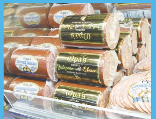
■ 「祖父煙肉」的多款香腸。