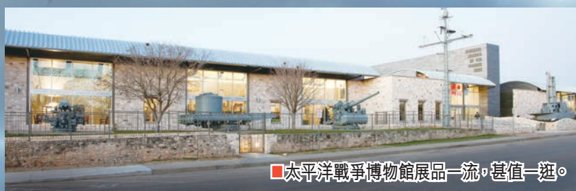
■ 太平洋戰爭博物館展品一流，甚值一逛。