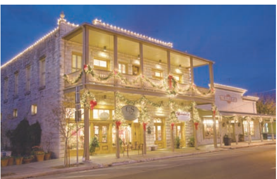
■ 佛堡的聖誕燈飾，節日氣氛甚濃。

佛堡是喜愛油畫和藝術品朋友的天堂，「主街」及附近有超過十二間藝廊讓您細心欣賞。在東425號「主街」的Whistle Pik Galleries是著名的油畫大師G. Harvey在全美的唯一一間展廊之一。他是德州本土人，現居佛堡，已年邁八十，作品是收藏家爭相採購的對象。坐落在西214號的Insight Gallery改建自一幢1907年的樓房，內部裝潢寬敞具氣派，出自各名家的手筆令人目不暇及。