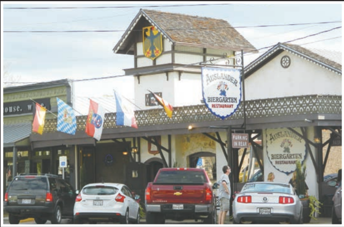
■ Auslander 餐廳的德國式建築外型。