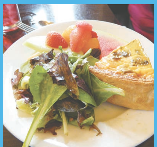
■ Farm Haus Bistro 的美食。

美食美酒、德國風情、藝文薈萃、歷史追憶，正是佛堡的吸引處。不論您是在四月前往欣賞漫山斑斕的野花，八月採摘成熟的蜜桃，十月啤酒節的狂歡或十二月聖誕樹亮燈，平實的佛堡總會讓您有意想不到的溫馨。