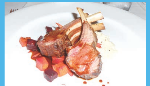
■ August E. 餐館的羊扒恰到好處。