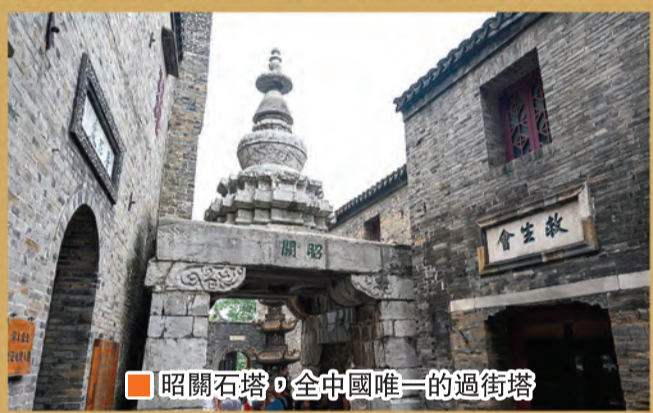
昭關石塔，全中國唯一的過街塔

我在2008年旅遊鎮江時，難得有機會在鎮江金茂酒店吃了頓全魚宴，品嚐了多種長江江鮮。一櫃子上放滿了桂魚（取其「貴」音，表示歡迎貴賓到訪）、鮑魚（希望您再回來！）、紅燒鮑魚、白魚、撻沙河底魚、辣椒雜魚、長江水魚和鮮甜無比的鱧魚湯，加點鎮江香醋簡直是人間美味！十年前號稱長江三大名魚的刀魚、鱈魚和河豚已不多見，今時今日野生的刀魚和鱈魚基本上已絕跡，偶然捕獲的是天價叫賣。過度捕撈，長江生態環境污染破壞，長江大壩建成後水流改變影響迴游魚回江產卵等等問題，導致多種長江魚類瀕臨絕跡，是必須急切正視的問題！