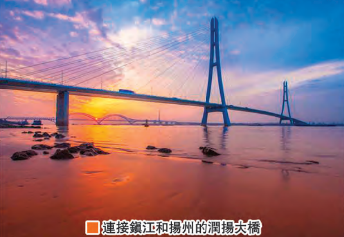
連接鎮江和揚州的潤揚大橋