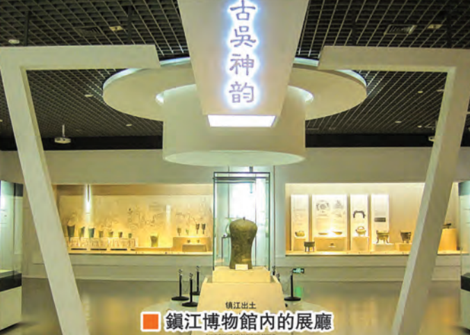
鎮江博物館內的展廳