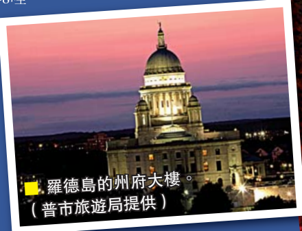
■ 羅德島的州府大樓。

普市建於1680年，建市先驅為 Roger Williams。他因不滿當時波士頓宗教領袖的排外和獨大，毅然出走到羅德島，創立新市鎮，命名為 Providence，意即「天佑之城」。現今市內的威廉斯公園樹立了他的紀念銅像，供人致敬。