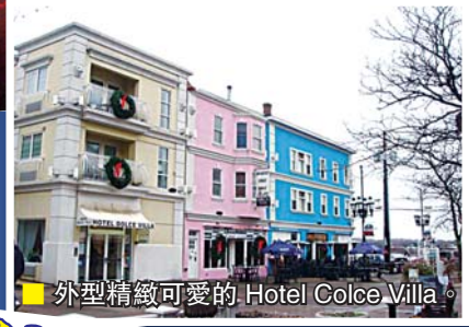
■ 外型精緻可愛的 Hotel Colce Villa。