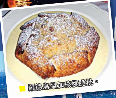
■ 羅德島梨加核桃脆批。