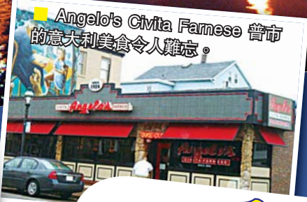
■ Angelo's Civita Farnese 普市的意大利美食令人難忘。