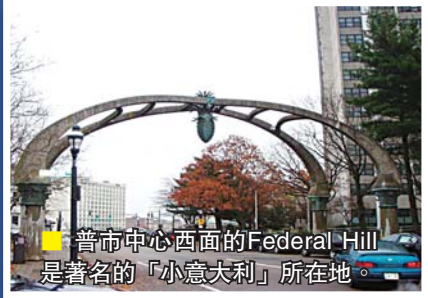
■ 普市中心西面的Federal Hill是著名的「小意大利」所在地。

普市建於1680年，建市先驅為 Roger Williams。他因不滿當時波士頓宗教領袖的排外和獨大，毅然出走到羅德島，創立新市鎮，命名為 Providence，意即「天佑之城」。現今市內的威廉斯公園樹立了他的紀念銅像，供人致敬。