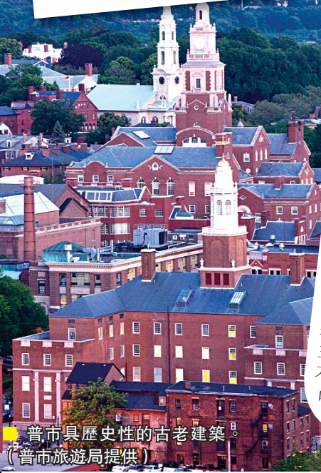
■ 普市具歷史性的古老建築