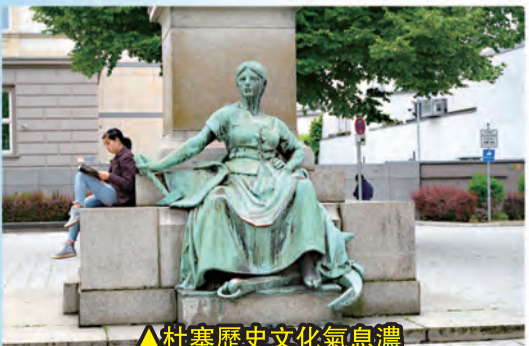
▲杜塞歷史文化氣息濃