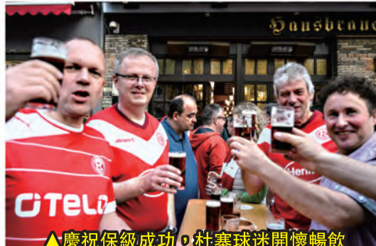
▲慶祝保級成功，杜塞球迷開懷暢飲