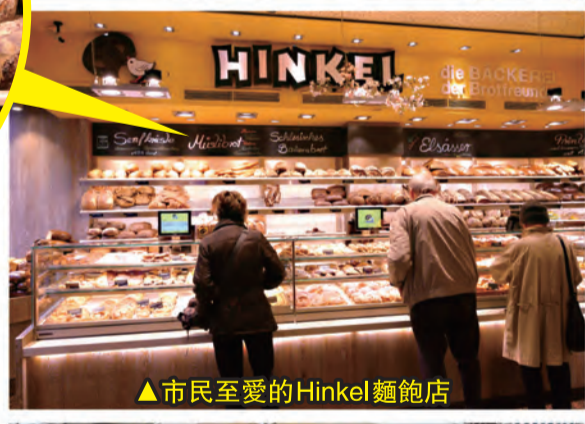
▲市民至愛的Hinkel麵包店