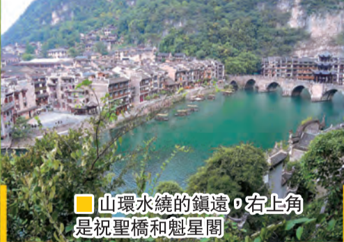
■山環水繞的鎮遠，右上角是祝聖橋和魁星閣