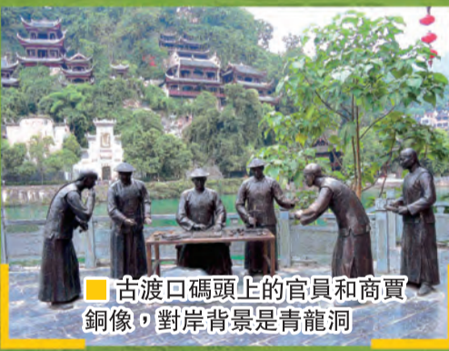
■古渡口碼頭上的官員和商賈銅像，對岸背景是青龍洞