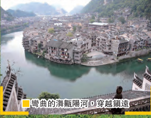
■彎曲的澧陽河，穿越鎮遠