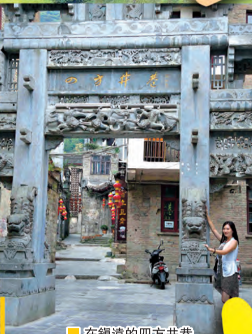
■在鎮遠的四方井巷