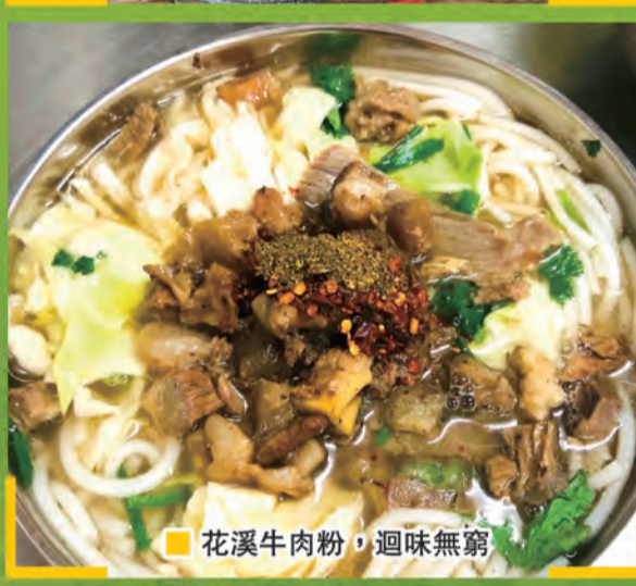
■花溪牛肉粉，迴味無窮