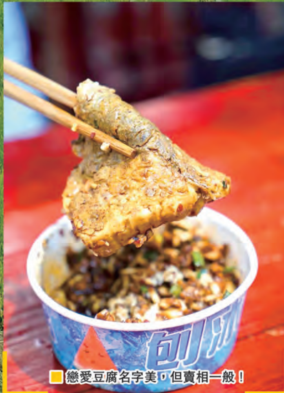
■戀愛豆腐名字美，但賣相一般！