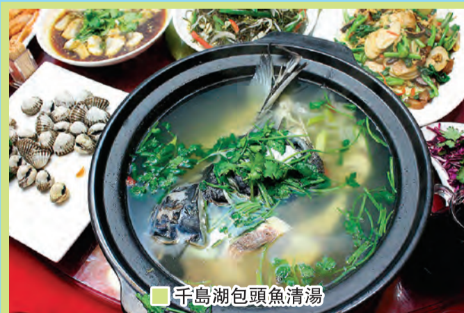
■ 千島湖包頭魚清湯

當地人原本稱這些橋為八字橋或蜈蚣橋，後因受美國賣座電影「廊橋綺夢」的影響，才改稱為廊橋，這說起來還是有段故事的！由大明星奇連伊士活（Clint Eastwood）和梅麗史翠珊（Meryl Streep）主演的1995年愛情大片「廊橋綺夢」（The Bridges of Madison County）描述一個帶有文藝小心思的中年家庭主婦，面對一個毫無情趣的丈夫，在小鎮過著一段淡如白開水的婚姻。在