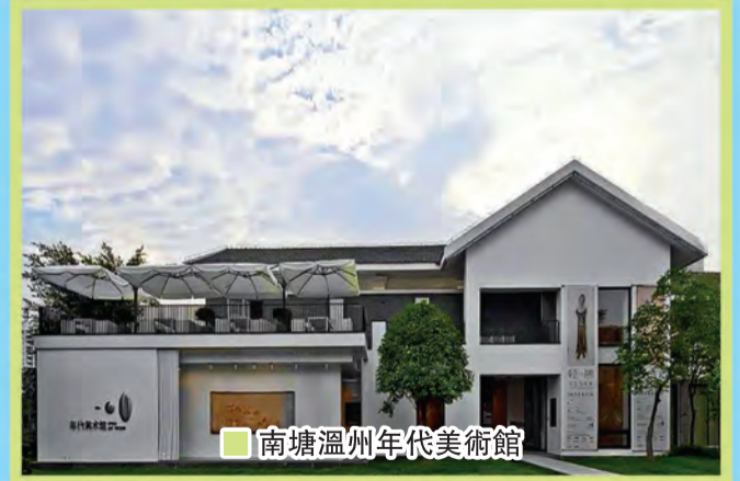
■ 南塘溫州年代美術館