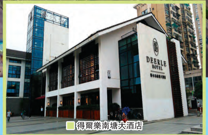
■ 得爾樂南塘大酒店

每日當夕陽西下，華燈初上之際，便是泛舟南塘河最美的時刻。沿岸商舖和渡橋上奪目的燈飾，美得人看呆。南塘餐館眾多，是吃喝的集中地。其中「得爾樂南塘大酒店」的招牌菜「奶湯魚頭」必須一嘗。此湯用來自浙江省北部千島湖的「淳」牌有機魚頭煮成，鮮甜無比。當魚頭被一掃而空的時候，再加份粉干到魚湯裏，伴著吃，簡直是人間美味！