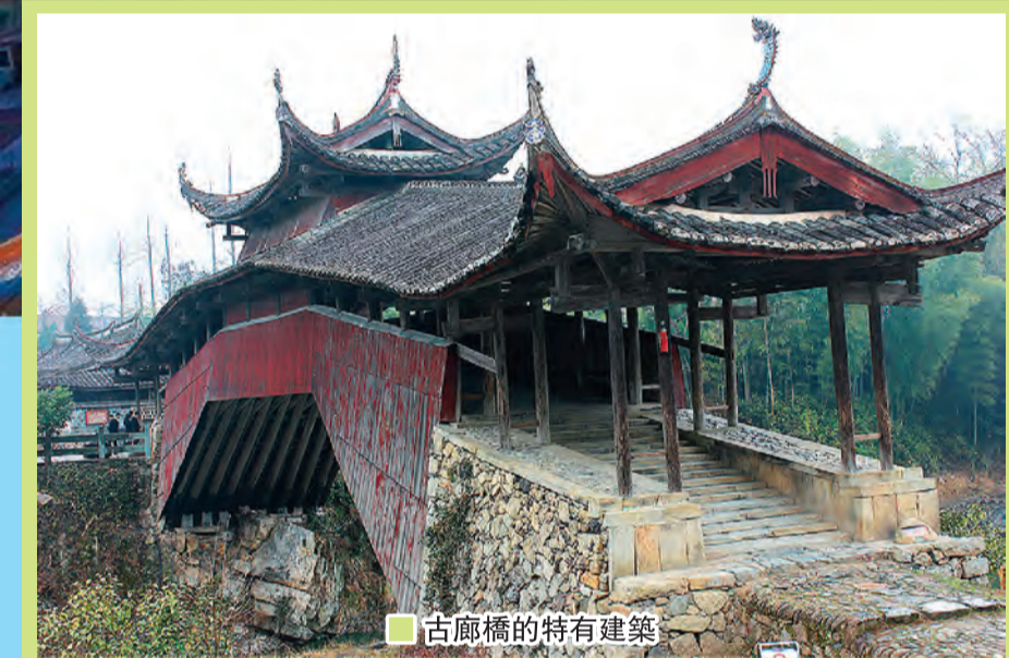
■ 古廊橋的特有建築