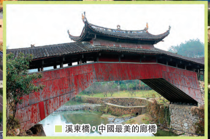
■ 溪東橋，中國最美的廊橋