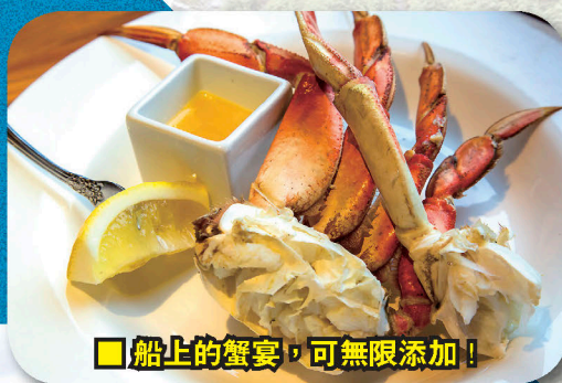
■ 船上的蟹宴，可無限添加！

棲息生活在這一帶的陸上動物還有狼、紅狐、麋鹿、Sitka鹿(一種體型較小的鹿)、山羊、河獺、禿頭鷹和阿拉斯加特有的「香蕉爬蟲」(Banana Slug)等等。海洋生物則更多樣化。在今次的旅程我能親眼看見座頭鯨