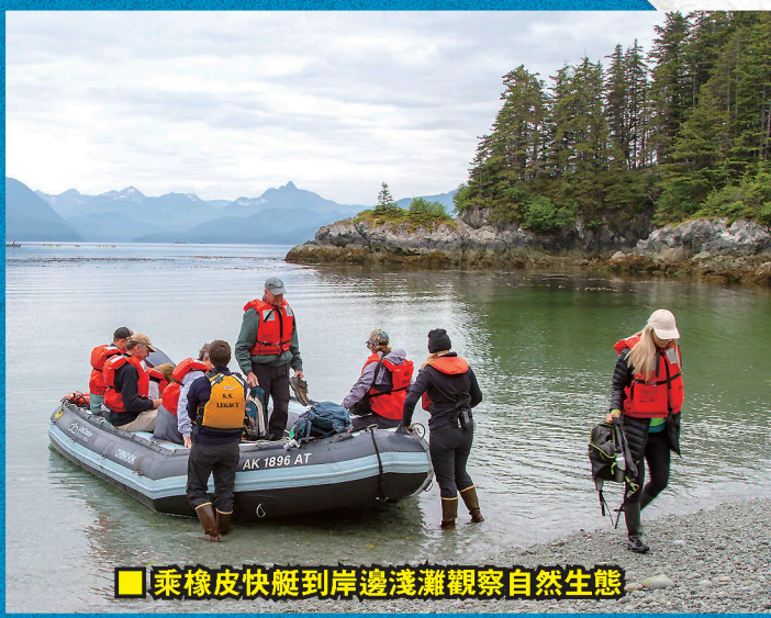
■ 乘橡皮快艇到岸邊淺灘觀察自然生態