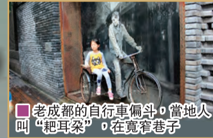
老成都的自行車偏門，當地人叫「耙耳朵」，在寬窄巷子

展成中國大西部最國際化的城市。該市的雙流國際機場每年平均增加航班直飛亞洲、歐洲、美洲和中東各地。