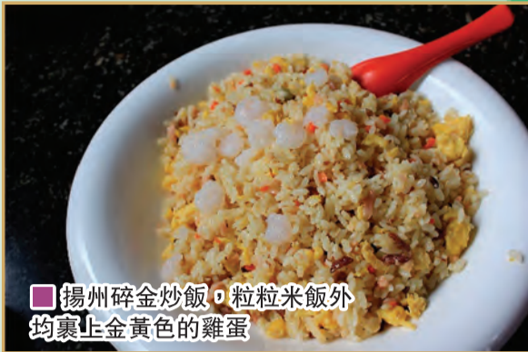
揚州碎金炒飯，粒粒米飯外均裹上金黃色的雞蛋

在神州大地芸芸城市之中，我特別喜歡揚州和成都。有朋友曾問我，如任我挑選，我最想定居的中國城市是哪一處？我毫無猶疑的首選必定是成都，其次是揚州。數年前我第一次造訪成都，立即驚為天人，發覺該市在多方面均比北京、上海或廣州吸引人。我與成都無異是一見鍾情；成都絕對是一座來了就走不了的城市！揚州也是來了便不想走，但需要花點時間認識，逗留久了便會很喜歡。