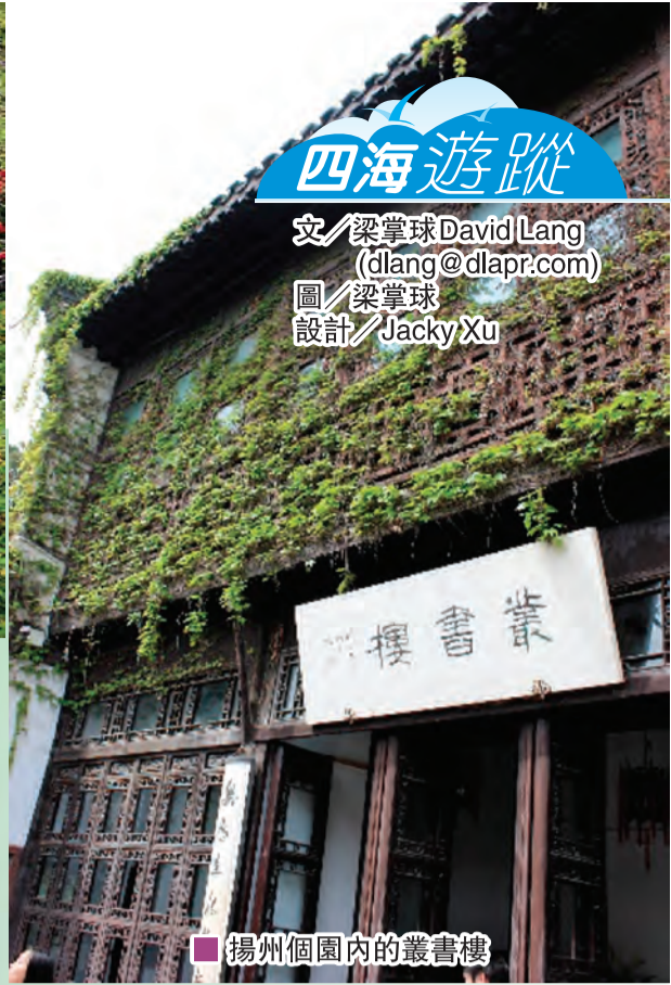
揚州個園內的叢書樓

在神州大地芸芸城市之中，我特別喜歡揚州和成都。有朋友曾問我，如任我挑選，我最想定居的中國城市是哪一處？我毫無猶疑的首選必定是成都，其次是揚州。數年前我第一次造訪成都，立即驚為天人，發覺該市在多方面均比北京、上海或廣州吸引人。我與成都無異是一見鍾情；成都絕對是一座來了就走不了的城市！揚州也是來了便不想走，但需要花點時間認識，逗留久了便會很喜歡。