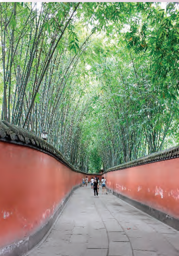
四川寺院內的竹巷