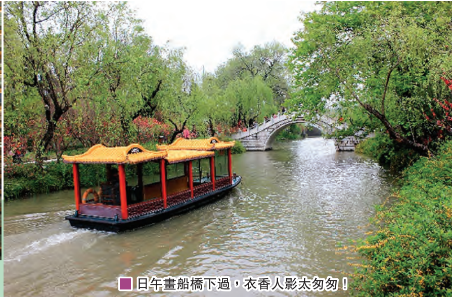
日午畫船橋下過，衣香人影太匆匆！