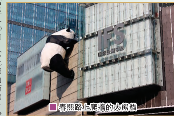
春熙路上爬牆的大熊貓

商很多僑居在揚州、揚州當時的人口已達五十多萬。至元朝時，來自意大利的商人和旅行家馬可波羅（Marco Polo）在揚州擔任了三年的路總管（1282-1285），大可能是第一個在中國做官的歐洲外國人！每當提起此事，揚州人仍滿臉得意！相比下，成都則偏處在西南內陸，雖有南方絲綢之路與西亞建立聯繫，但與其他外國接軌較晚。在過去十多年，成都急起直追，快速發