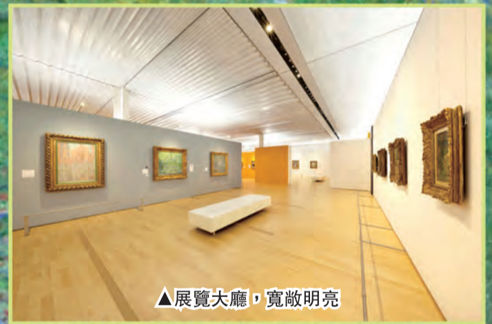
▲展覽大廳，寬敞明亮