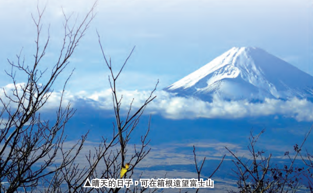
▲晴天的日子，可在箱根遠望富士山