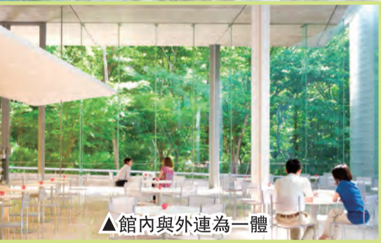
▲館內與外連為一體

看罷室內展品，勿忘往館外的林蔭步道閒逛一會。此處種滿參天的山毛櫸和大片的姬沙羅群，各種的藝術雕塑散佈其中。夏日微風拂面，秋季紅黃落葉，把大自然與藝術之美融為一體，令人沉醉！