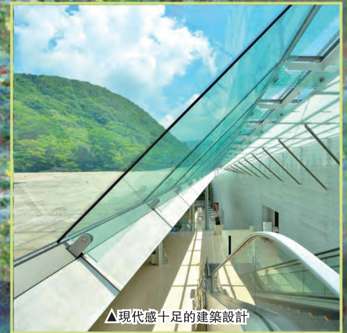
▲現代感十足的建築設計