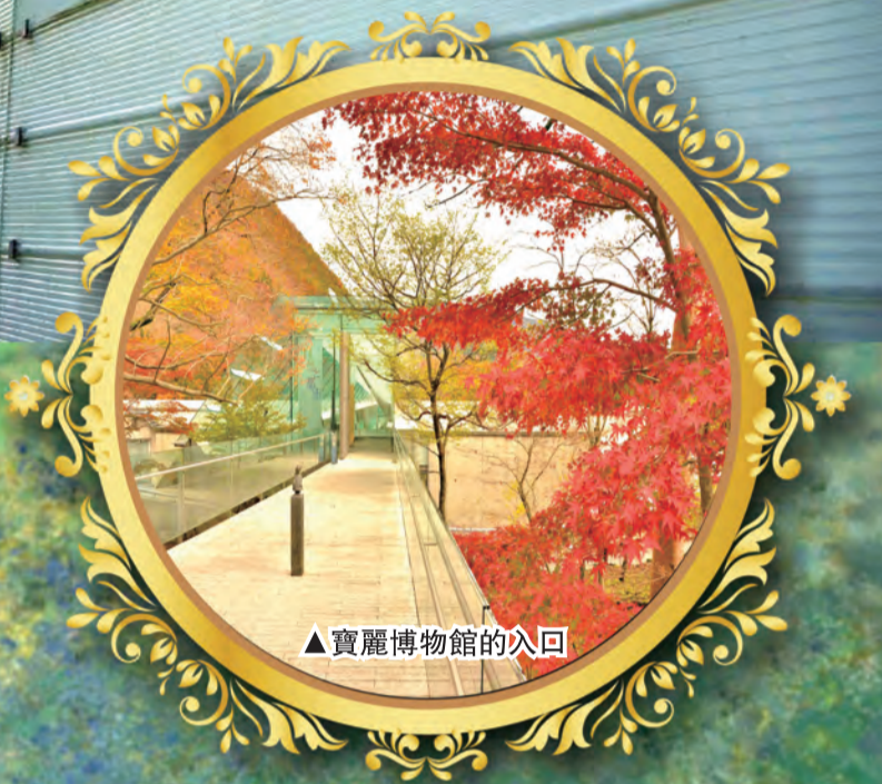
▲寶麗博物館的入口