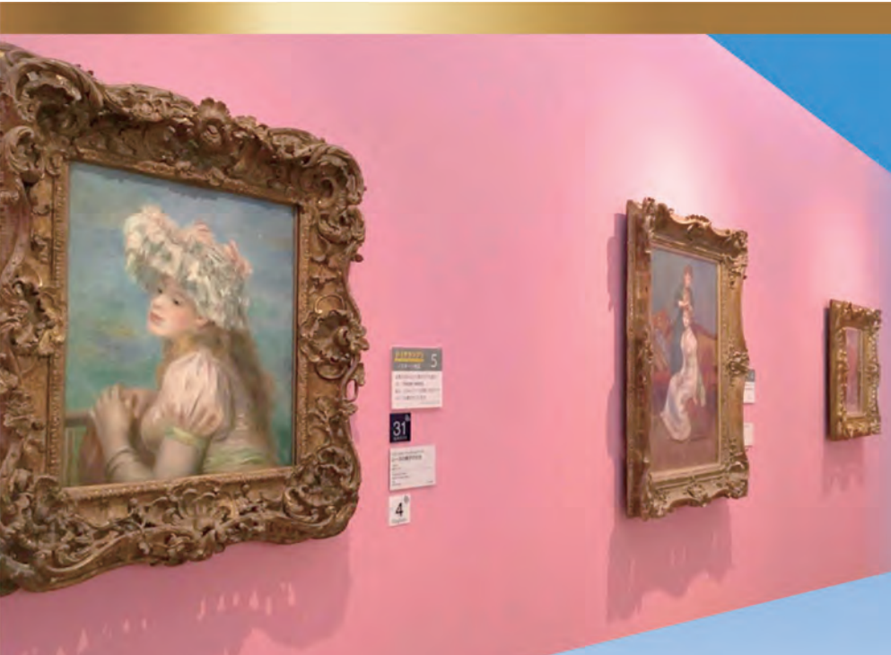
▲館內收藏不少世界名畫

一般具規模的藝術博物館，大多立足于車水馬龍的繁華大都會，方便遊人前往參觀。處於日本神奈川縣（Kanagawa）的寶麗美術館（Pola Museum of Art）則與眾不同，深藏在富士箱根伊豆國立公園內。由東京前往的觀光客要費把勁先坐列車或長途巴士到箱根溫泉鎮，再轉乘當地旅遊穿梭巴士到達館前下車。雖然要經歷舟車勞頓，但此館環境之美、藏品之豐，是絕對值得一游！