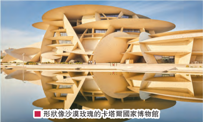
形狀像沙漠玫瑰的卡塔爾國家博物館

四年一次的世界杯足球大賽，今年底十一月至十二月中將會在中東地區的卡塔爾 (Qatar) 盛大舉行。踢足球是全世界最受歡迎的體育運動，每季的英超、西甲、意甲或歐冠在舉行期間，全球的億萬球迷粉絲無論身在何地，均會起早貪黑、廢枕忘餐地專注在電視機前，觀賞直播球賽！世界杯大賽更是足球界的最高榮譽，全球矚目、能奪桂冠是出席三十二強的每隊夢想！