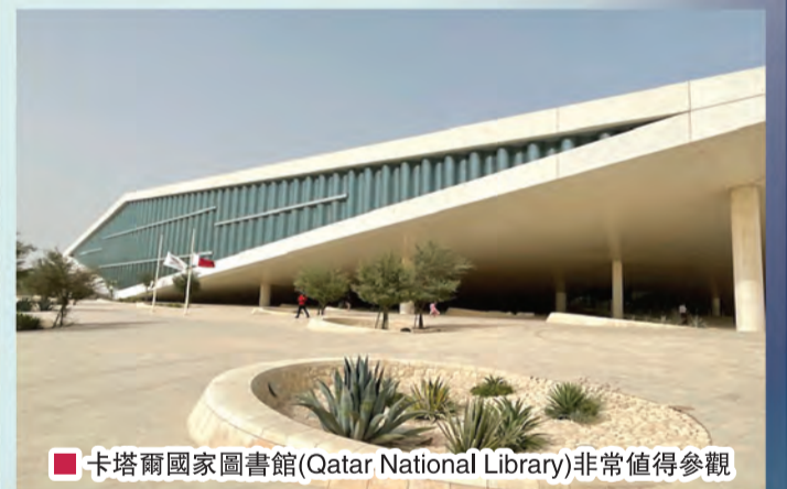
卡塔爾國家圖書館 (Qatar National Library) 非常值得參觀