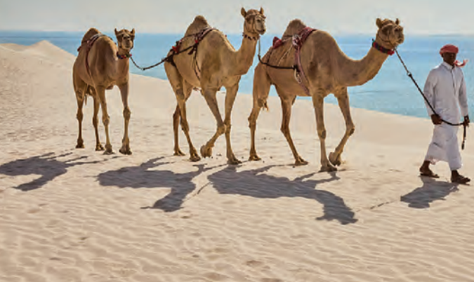
沙漠之舟與游牧族人