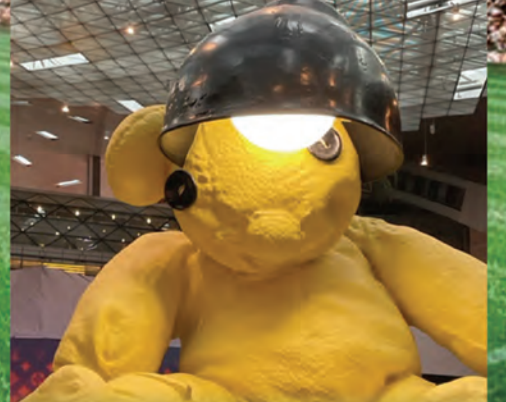
在哈馬德機場內大堂擺放的巨型燈熊 (Lamp Bear) 由瑞士藝術家Urs Fischer創造，遊客必須打卡！