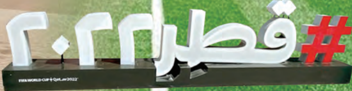
在多哈街頭迎接世界杯的標語