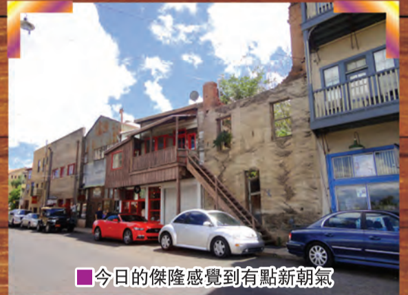
■今日的傑隆感覺有點新朝氣