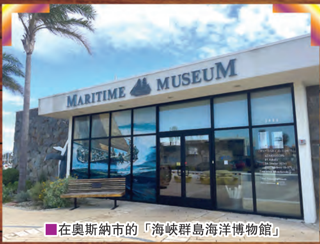
■在奧斯納市的「海峽群島海洋博物館」