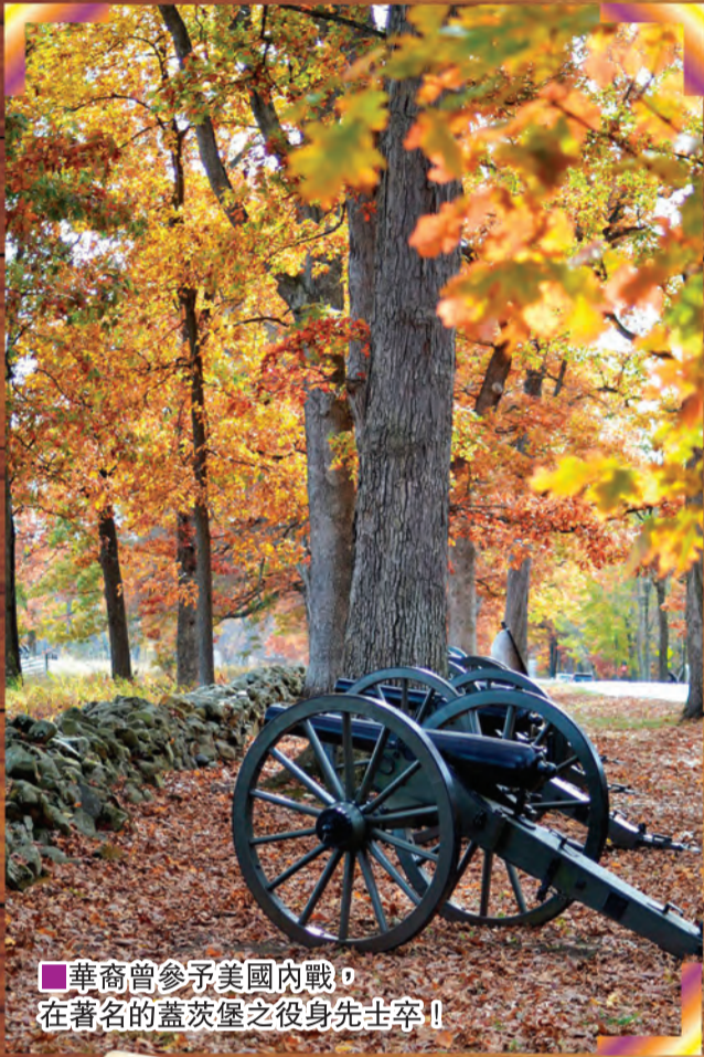
■華裔曾參予美國內戰，在著名的蓋茨堡之役身先士卒！