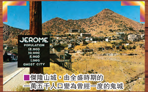
■傑隆山城，由全盛時期的二萬五千人口變為曾經一度的鬼城