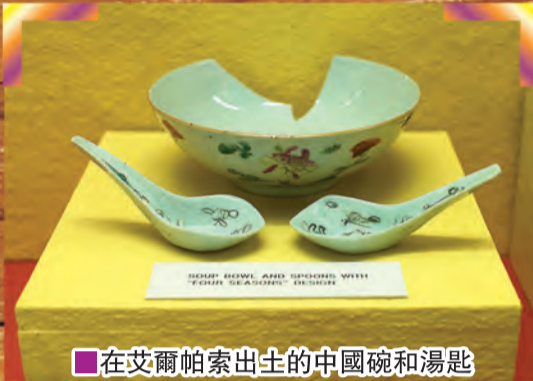
■在艾爾帕索出生的中國碗和湯匙