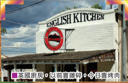
■英國廚房，以前賣雜碎，今日賣烤肉