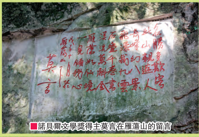
■諾貝爾文學獎得主莫言在雁蕩山的留言