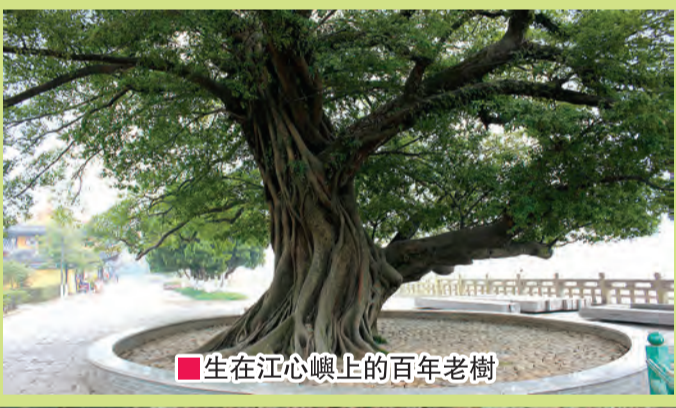
■生在江心嶼上的百年老樹