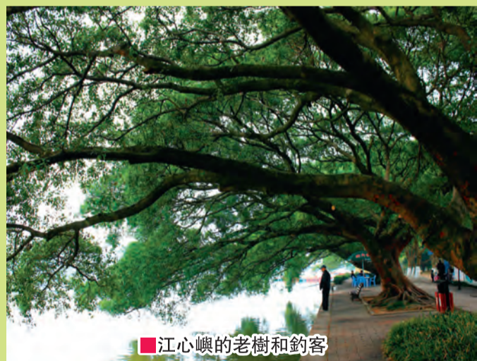
■江心嶼的老樹和釣客