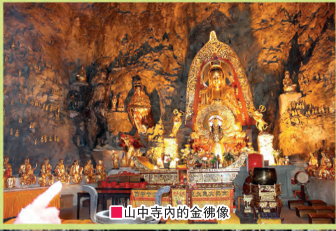
■山中寺內的金佛像