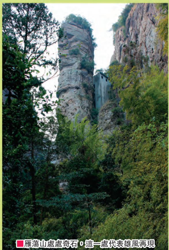
■雁蕩山處處奇石，這一處代表雄風再現