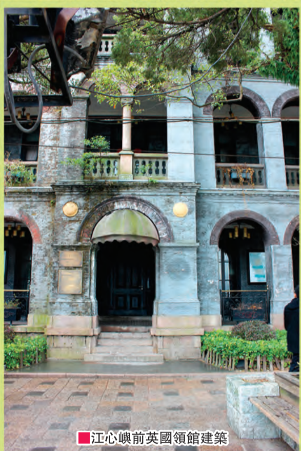
■江心嶼前英國領館建築