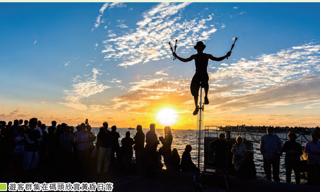
遊客群集在碼頭欣賞黃昏日落