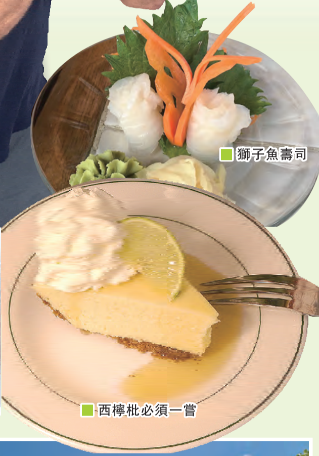
西檸檬枇必須一嘗