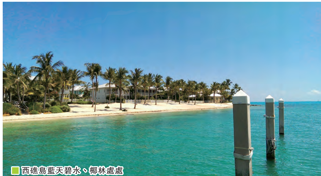
西礁島藍天碧水、椰林處處