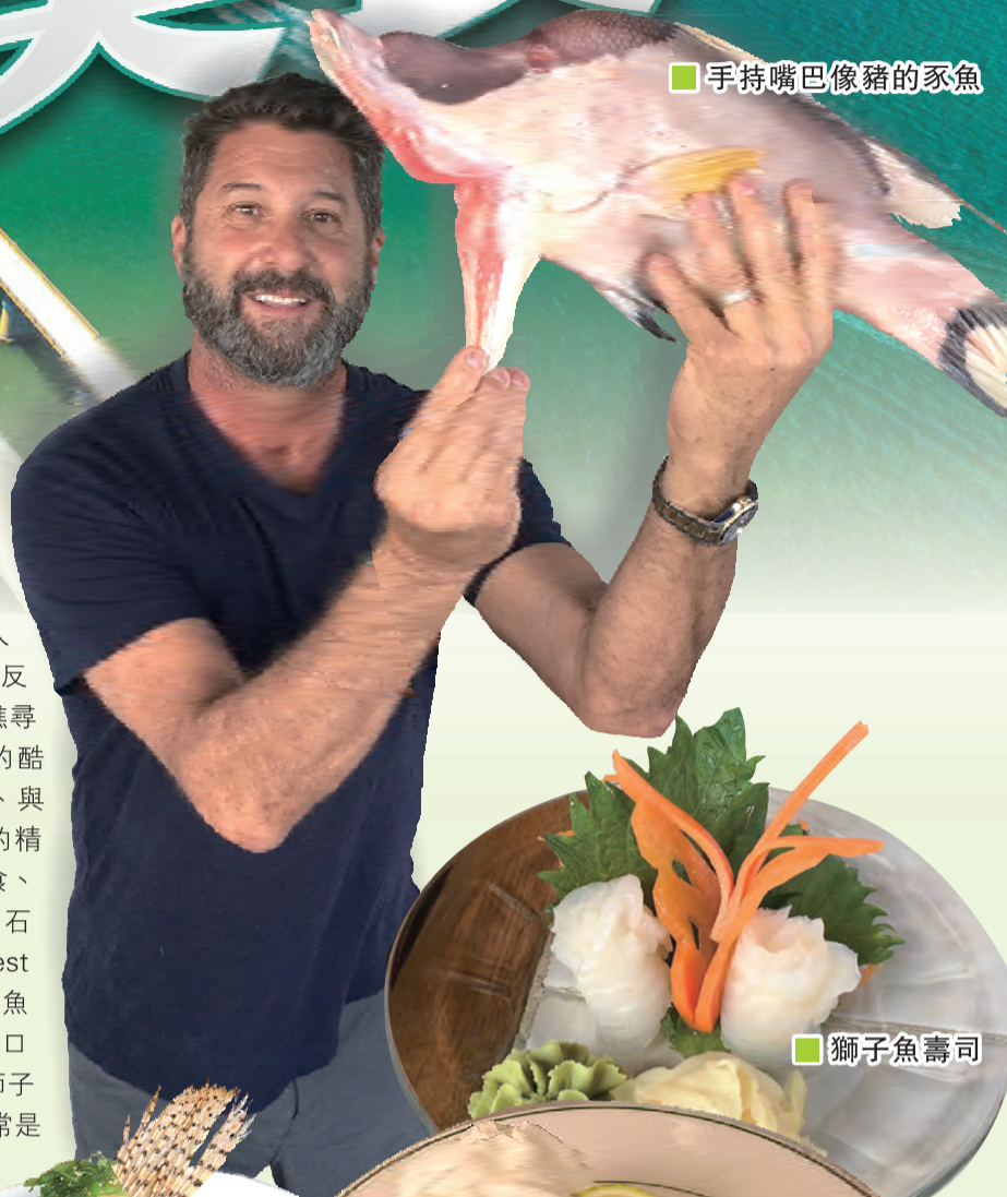
手持嘴巴像豬的豕魚