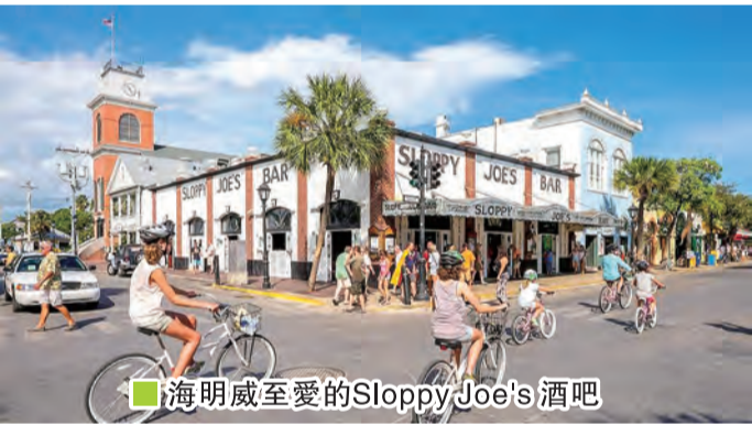
海明威至愛的Sloppy Joe's 酒吧

因天氣和風景的關係，西礁島歷年來吸引了不少詩人墨客前往度假或長住，人文薈萃。「慾望號街車」的作者田納西·威廉斯（Tennessee Williams）在這處住了數十年。名詩人佛羅斯特（Robert Frost）則在西礁島每年避寒度過了十六個冬天。但不幸自古文人常常相輕，盛傳海明威與另一名詩人華萊士·史蒂文斯（Wallace Stevens）有一晚在酒吧買醉時相遇、初則口角繼而動武，最終兩敗俱傷，成為後人茶餘飯後的趣談！海明威深愛的酒吧Sloppy Joe's仍在西礁島的主要商業街Duval St開業，只不過是搬了往對街，因在1937年時房東要把每月租