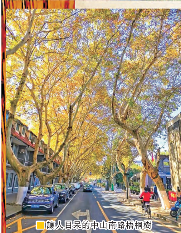
讓人目呆的中山南路梧桐樹