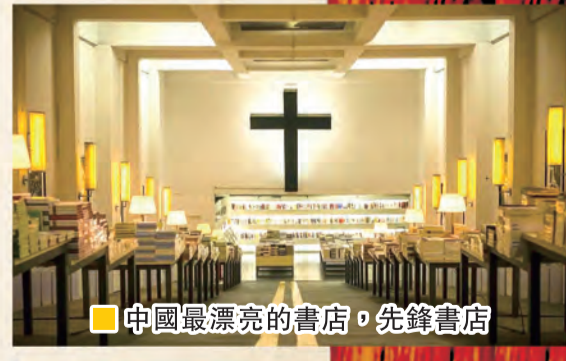
中國最漂亮的書店，先鋒書店