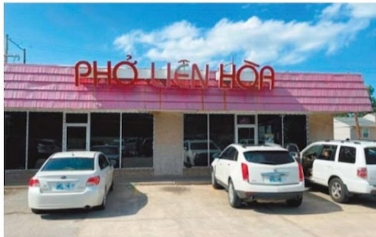
Pho Lien Hoa 是越南牛 Pho 首選店之一

是不夠時間的。但我起碼對這座以前完全陌生的城市有了初步的認識,也獲得一些驚喜!我在機場等候航班飛回家時,想起一位當地人對我說的一句很玄的話:“No one chooses to live in Oklahoma. Oklahoma chooses you.”直譯是