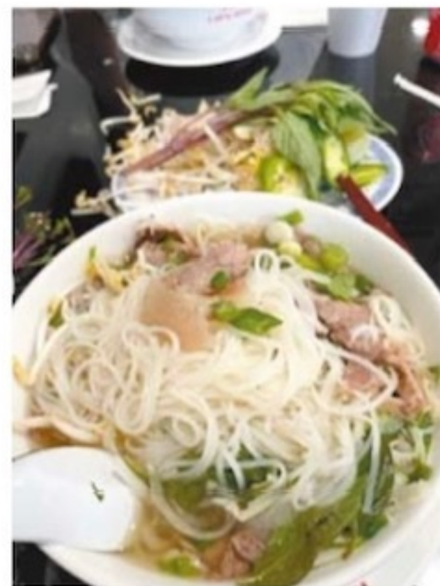
在奧城能嘗濃湯滑粉牛肉 Pho, 喜出望外!