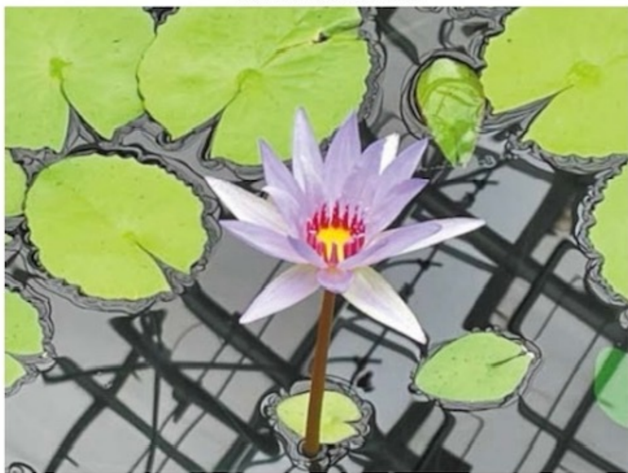
植物園內罕見的紫色蓮花