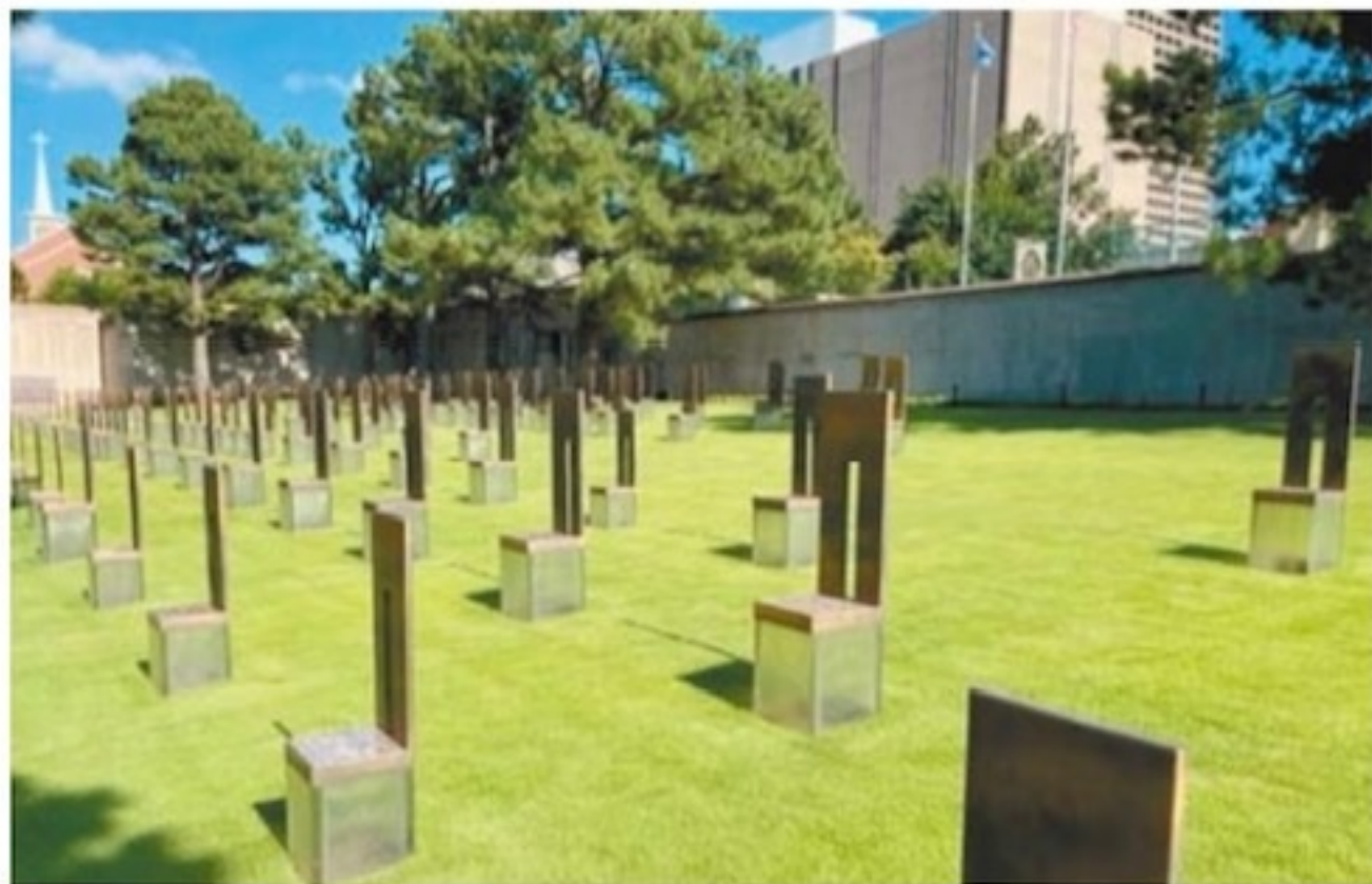
168 張空椅,代表 168 位逝去的生命

粉(Pho)! 我對奧城所知一向甚少,在今年七月前往旅遊之前,我心裡的黑板印象是一座白種人話事的城市、非常保守和甚少多元文化。不說不知,這情況在 1975 年越南赤化後便開始慢慢改變,當時大量的越南難民逃離家園,部分獲美國教會贊助移居奧城,在 Classen Blvd 和 NW 23rd St 一帶落腳聚居,直至 2000 年初時已形成一亞裔社區,開設了各行各業如餐館、咖啡店、麵包舖、雜貨店、超級市場、和亞裔專業會計師、律師和醫生等的事務所。現時奧市主要的亞裔群體是越裔、華裔、苗族和韓裔。該市市議會在 2004 年投票通過成立「亞洲區」,正式劃分成為該市的一個行政區域。