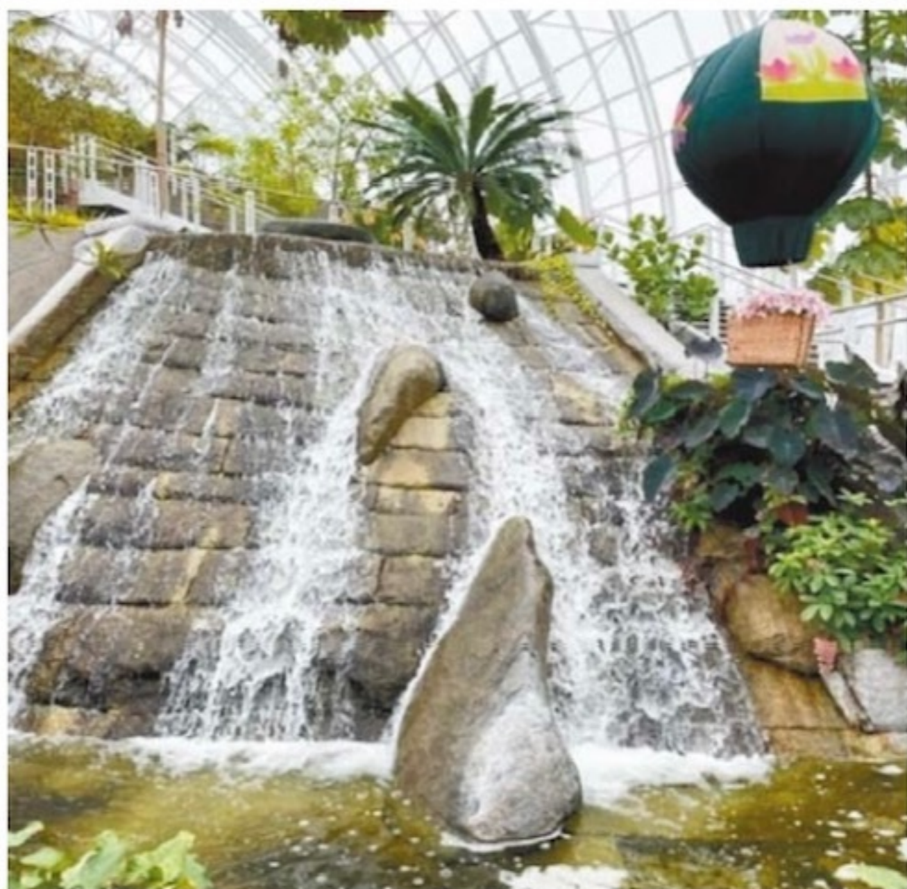
無窮植物園內的玻璃溫室

奧城的亞洲區:奧城給我最大的驚喜是擁有頗具規模的「亞洲區」(Asian District),高達五萬六千人的亞裔居民和美味的越南牛肉湯