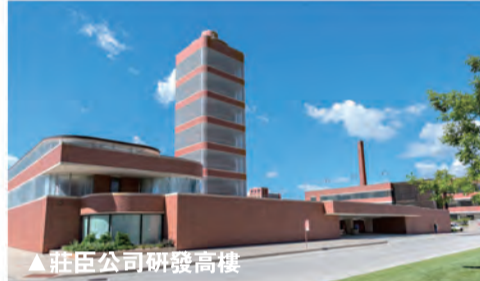
▲莊臣公司研發高樓