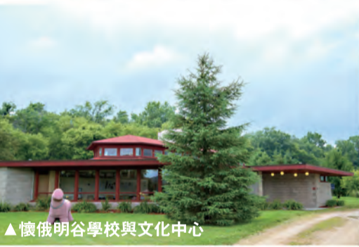
▲懷俄明谷學校與文化中心