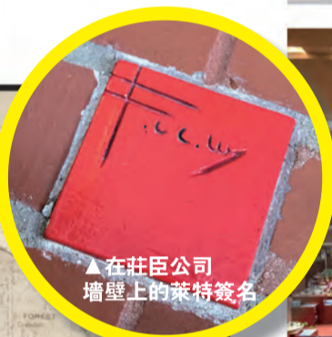
▲在莊臣公司牆壁上的萊特簽名