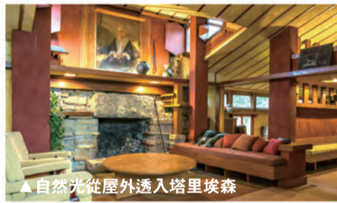
▲自然光從屋外透入塔里埃森