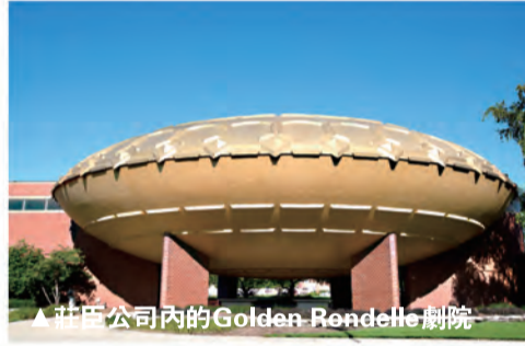
▲莊臣公司內的Golden Rondelle劇院