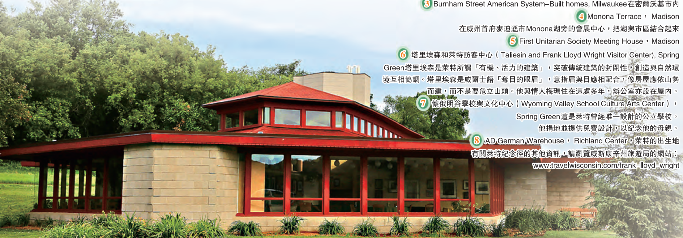
▲懷俄明谷學校與文化中心

有關萊特紀念徑的其他資訊，請瀏覽威斯康辛州旅遊局的網站： www.travelwisconsin.com/frank-lloyd-wright