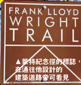
▲萊特紀念徑的標誌，在通往他設計的建築道路旁可看見