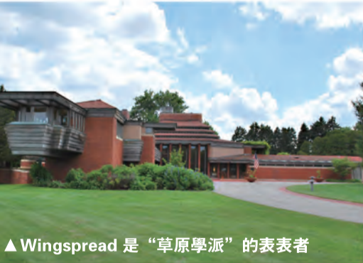
▲Wingspread 是“草原學派”的表表者