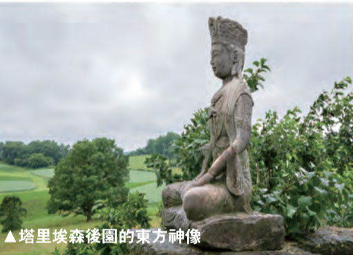
▲塔里埃森後園的東方神像