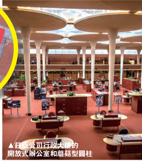
▲莊臣公司行政大樓的開放式辦公室和蘑菇型圓柱