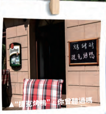
▲“捷克烤鴨” 你會聽過嗎