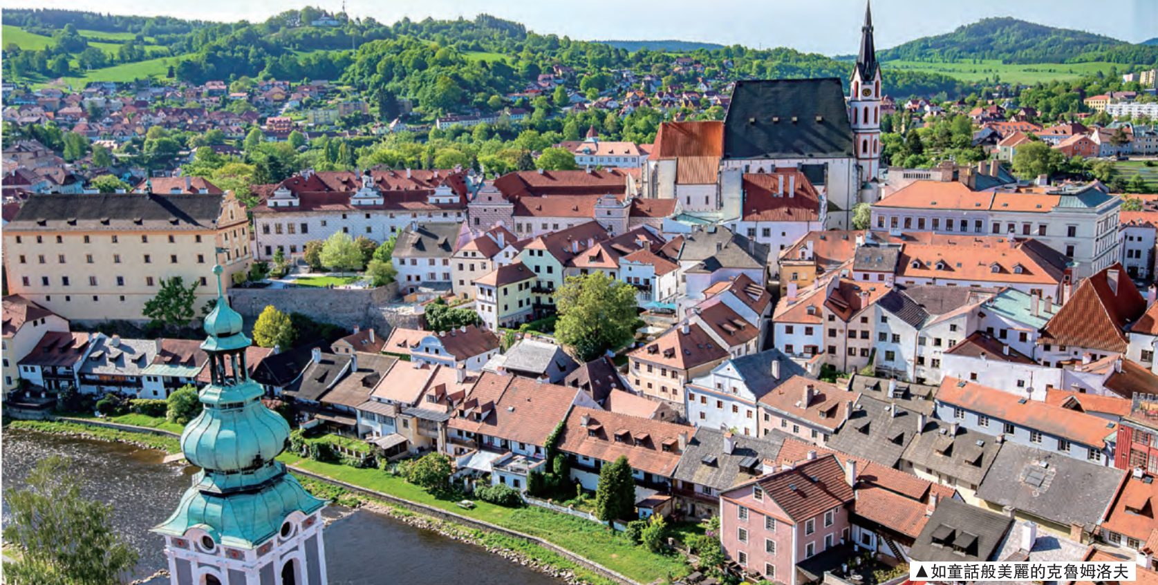
▲如童話般美麗的克魯姆洛夫