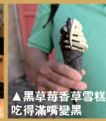
▲黑草莓香草雪糕 吃得滿嘴變黑

一般人往捷克旅遊，通常是去首府布拉格，玩過三數天便離去，對該國的其它地方甚少踏足。我在數年前觀看歐遊專家Rick Steves介紹捷克遊點的電視節目時，被他強力推薦的南部小鎮克魯姆洛夫 (Český Krumlov) 的美麗景色深深吸引，即時把該地納入我的一生必遊名單。今年初夏終於找到了機會前往、一償夙願！