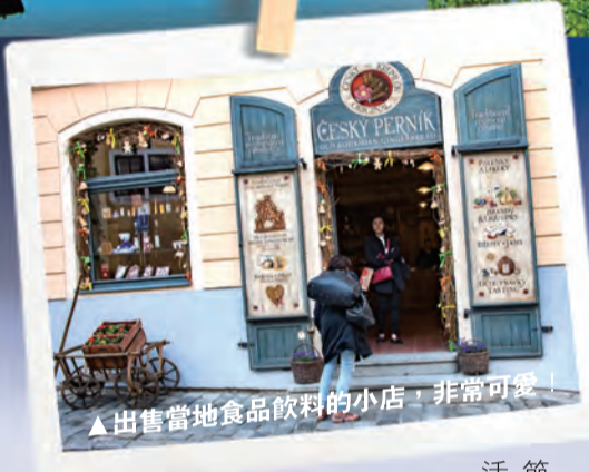
▲出售當地食品飲料的小店，非常可愛！