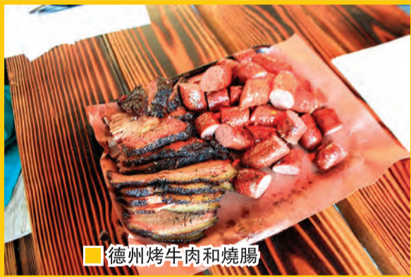
德州烤牛肉和燒腸

不說不知，在北美洲最早有人類聚居活動的地方之一是在拉伯克。據專家估計距今已有一萬兩千年的歷史。這重大的考古發現始於一九三六年，當時考古學家在乾涸的拉伯克湖底和四週發掘出已絕種的動物骨骼和人類生活的遺址工具，發掘工作由當地的考古學家帶領，在過去八十多年從未中斷。出土的人類遺物可追溯到人類歷史的不同年代，令專家相信過去一萬三千多年一直有人類在拉伯克地區生活。至於出土的動物骸骨更是洋洋大觀，包括哥倫比亞猛獁巨象(Columbian Mammoth，全身沒有長毛的，有別於生活在寒冷地區的長毛猛獁)、古野牛(體型比現代野牛大很多)和駱駝。駱駝原是北美土產，取道曾經連接北美洲和亞洲的白令海峽陸橋遷徙至亞洲。這克湖國家歷史遺址 National 步道，可健行參