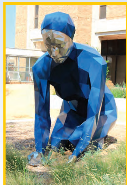
大學校園可安排公共藝術導賞團

人曰地靈人傑，拉伯克雖然不至於是窮山惡水，但絕對不是肥沃秀美之地，卻孕育出一位最早期的搖滾樂先驅，名為巴迪霍利(Buddy Holly)。我相信這名字對大眾來說是陌生的，除非你是死忠的搖滾樂迷。巴迪1936年出生在拉伯克，正值美國的大蕭條年代，生活艱苦，但他自幼時已展露對音樂的才華和喜好。巴迪十多歲時已與好友組成樂隊在當地酒廊和電台節目演出，鋒芒畢露。其後他被著名的唱片製作公司Decca Records看中，簽約錄音。在1957年他廿一歲那年，他與他的「蟋蟀樂隊」(The Crickets)演唱的「That'll Be The Day」和