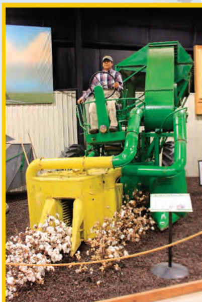
在拜仁農業博物館內展出的棉花收割機