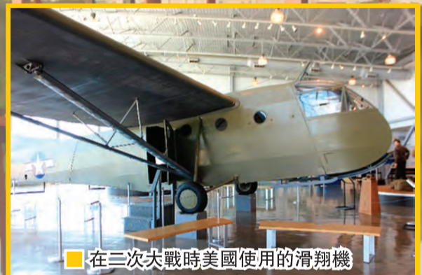
在三次大戰時美國使用的滑翔機