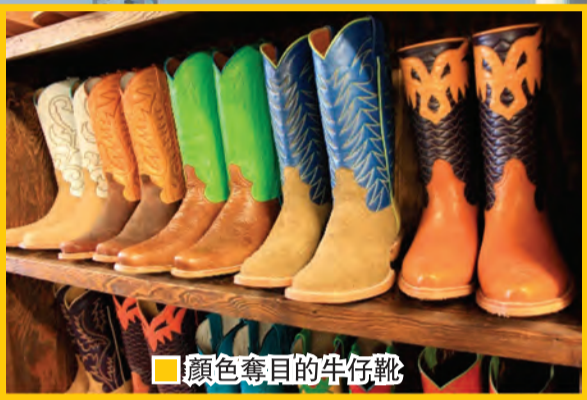
不同設計的风车抽水機