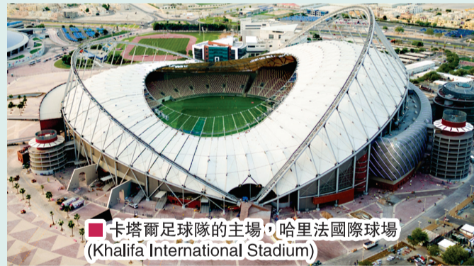
■ 卡塔爾足球隊的主場，哈里法國際球場 (Khalifa International Stadium)

擁有四萬座位的「974球場」 (Stadium 974) 是由九百七十四個可循環使用的集裝箱建成，此外974也是卡塔爾的國際長途電話撥打號碼，所以有雙重意思。世杯完結後整個球場將被拆掉，建築材料會被捐贈給發展中國家。同樣有四萬座位的「賈努布球場」 (Al Janoub Stadium) 由國際著名的建築師Zaha Hadid (1950-2016) 設計，靈感來自