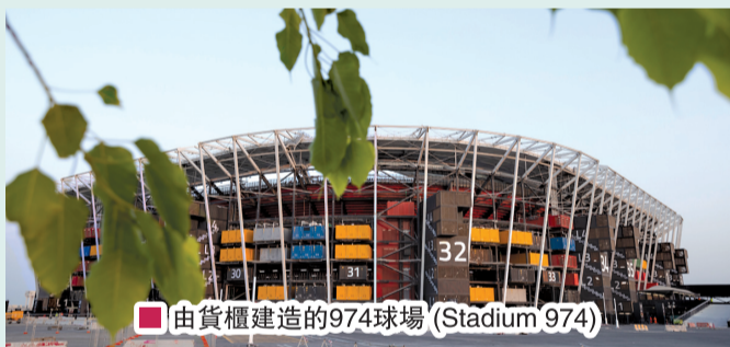
■ 由貨櫃建造的974球場 (Stadium 974)

行，即卡塔爾首都多哈 (Doha)。球迷將有機會，亦是歷史首次，在同一天內親身欣賞兩場或更多的比賽，這簡直是千載難逢的機會呀！