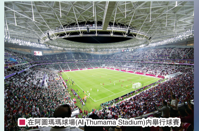
■ 在阿圖瑪瑪球場 (Al Thumama Stadium) 內舉行球賽