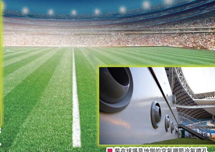
■ 裝在球場草地側的空氣調節冷氣噴孔