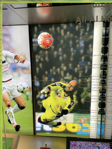
■ 來自安曼的Ali Habsi, 是第一位闖蕩英超的灣區阿拉伯漢子。2006年任保頓流浪隊的門將。3-2-1博物館當然要表彰這歷史記錄。