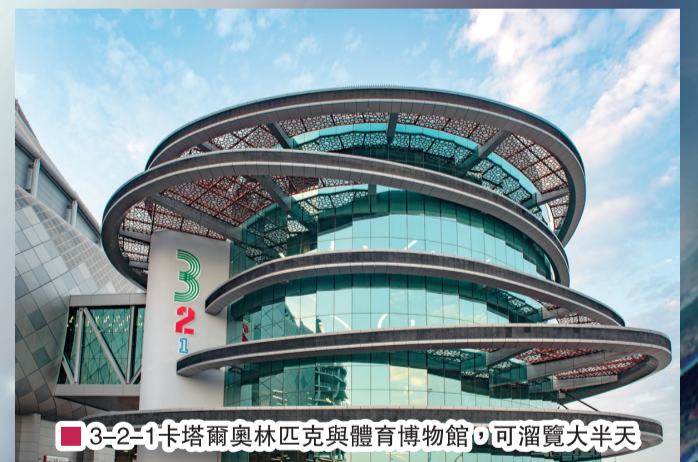
■ 3-2-1卡塔爾奧林匹克與體育博物館可溜覽大半天