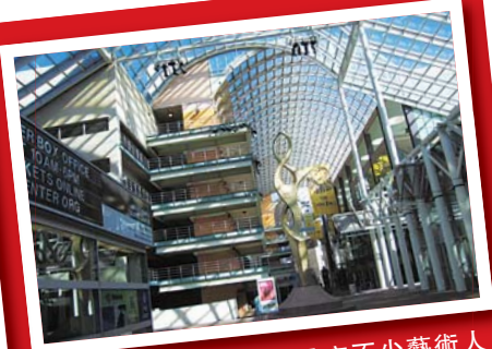
▲ 丹佛市的演藝中心孕育不少藝術人才。