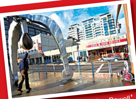
▲ 波特蘭處處充滿藝術氣息，Powell's 書局更是愛書者必到之處。（網路照片）