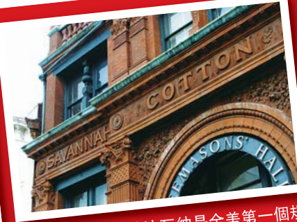
▲ 1733年建市的沙瓦納是全美第一個規劃開發的城市。