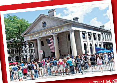
▲ 在波士頓的Quincy Market 可以品嚐即點即煮的新鮮龍蝦。